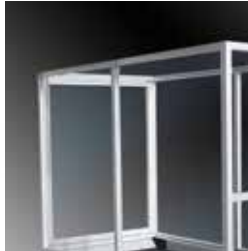
A richiesta: protezione Optional: protection guard