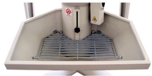
Détail de la trémie d'alimentation