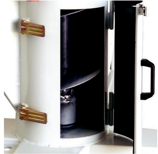
Inspection de la vis de mélange